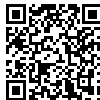
Richieste di inserimento in classifica

La giuria e le parti si riservano il diritto di limitare l'accesso pubblico a selezionati verbali.*