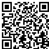
Verbali di protesta